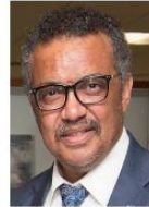
Tedros Adhanom Ghebreyesus