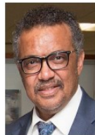
Tedros Adhanom Ghebreyesus