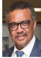
Tedros Adhanom Ghebreyesus