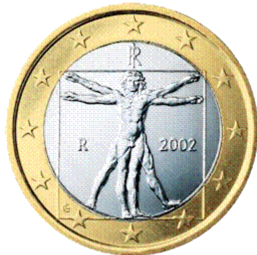
Pyès 1 euro italyen Ak l'Homme de Vitruve.