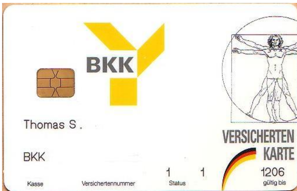
Modèl kat asirans maladi an Almay ak l'Homme de Vitruve.