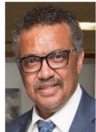
Tedros Adhanom Ghebreyesus