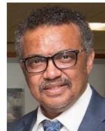
Tedros Adhanom Ghebreyesus